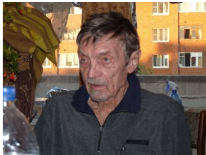
Пушино: неформальное общение