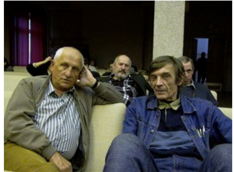
Конференц-зал ИТЭБ РАН