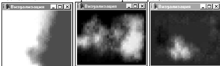
Рис. 3. Визуализация процесса этногенеза.

Созданное средство моделирования позволяет наблюдать динамику функции стереотипа поведения популяций и адаптации к ландшафту в плоскости месторазвития. Ниже приведены несколько типичных временных срезов процесса.